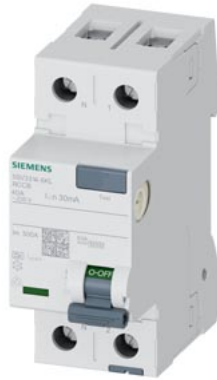
FI-Schutzschalter, 2-polig, Typ A, In: 40 A, 30 mA, Un AC: 230 V, N-links