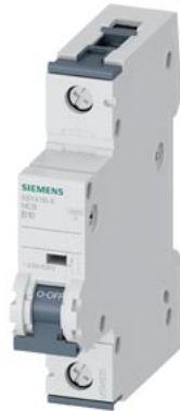
Leitungsschutzschalter 230/400V 10kA, 1-polig, B, 10A, T=70mm