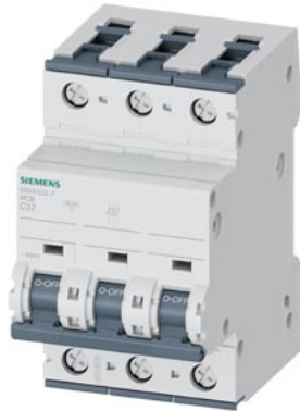
Leitungsschutzschalter 400V 10kA, 3-polig, C, 32A, T=70mm